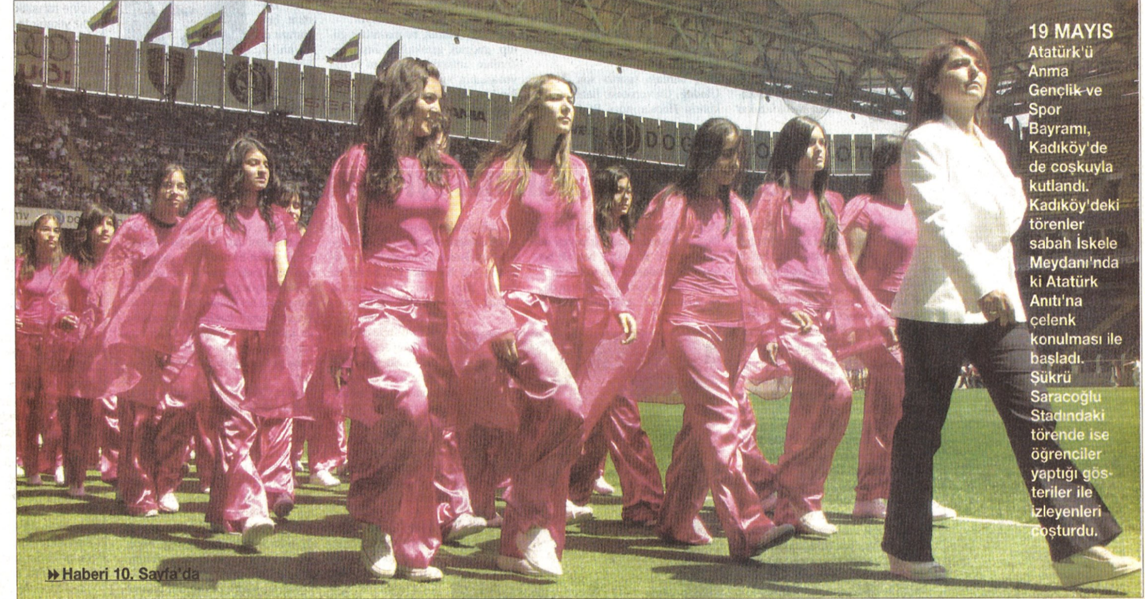
► Haberi 10. Sayfa'da

19 MAYIS Atatürk'ü Anma Gençlik ve Spor Bayramı, Kadıköy'de de coşkuyla kutlandı. Kadıköy'deki törenler sabah İskele Meydanı'nda ki Atatürk Anıtı'na çelenk konulması ile başladı. Sükrü Saracoğlu Stadındaki törende ise öğrenciler yaptığı gösteriler ile izleyenleri coşturdu.