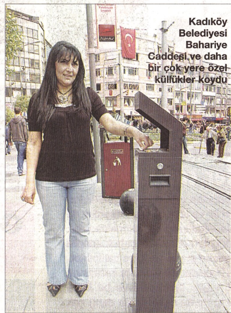
Kadıköy Belediyesi Bahariye Caddesi'ne ve daha bir çok yere özel külükler koydu