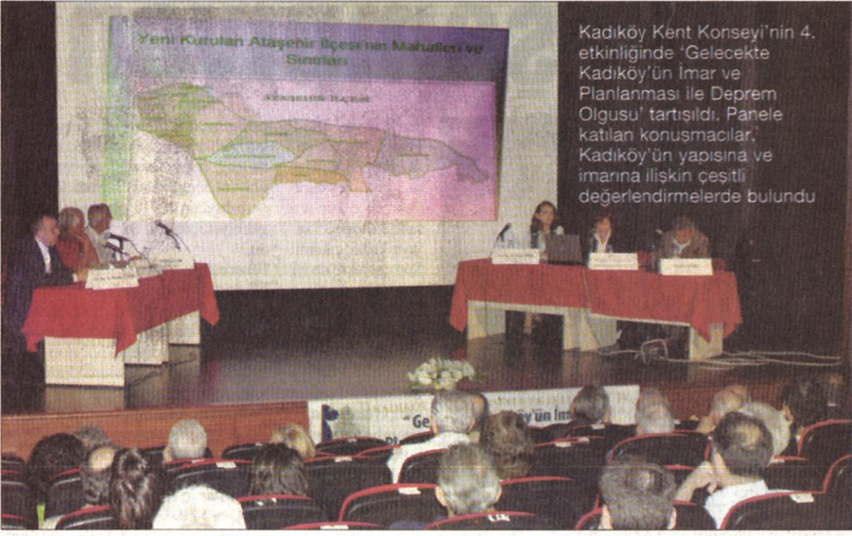
Kadıköy Kent Konseyi'nin 4. etkinliğinde 'Gelecekte Kadıköy'ün İmar ve Planlanması ile Deprem Olgusu' tartışıldı. Panelde katılan konuşmacılar, Kadıköy'ün yapısına ve imarına ilişkin çeşitli değerlendirmelerde bulundu.